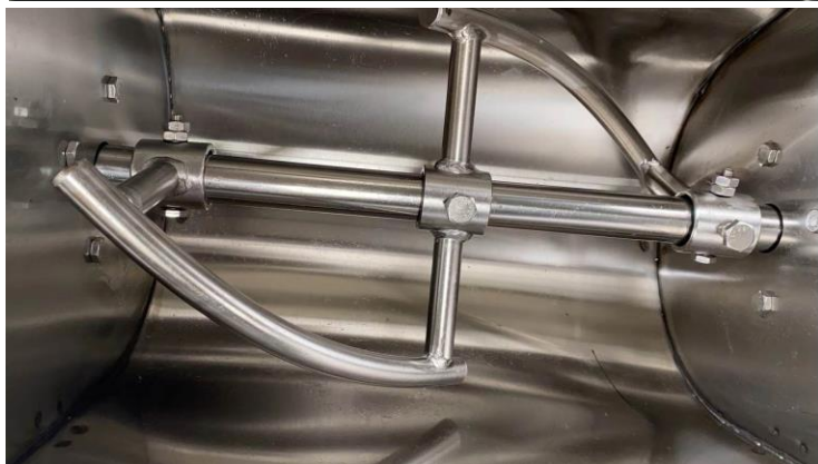
Месильный орган - Н